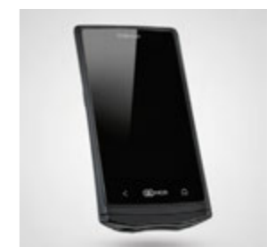
Orderman5+ : le modèle « plus » avec lecteur NFC (parfait pour les systèmes d'accès) et Bluetooth pour utiliser l'imprimante ceinture.