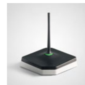
Réseau radio Orderman : stabilité et fiabilité uniques.