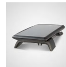
eBase pour le chargement et les mises à jour logicielles. Également utilisable en tant que mini-TPV portable.